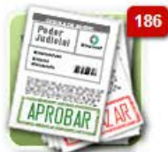
Aprobar o Rechazar Cédulas