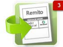
Envío de Lotes / Remitos