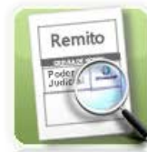
Consulta de Lotes / Remitos